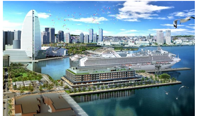
新しい横浜の顔、埠頭に位置する『横浜ハンマーヘッド』

また、「ハンマーヘッド SHOP&RESTAURANT」のテーマである“ファクトリー”を象徴する店舗、新港ふ頭客船ターミナル CIQ ホールにて開催される年末年始注目の展覧催事イベントをご紹介いたします。